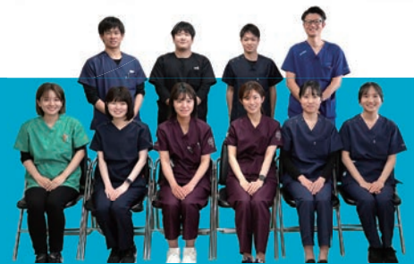
2024年度採用初期研修医